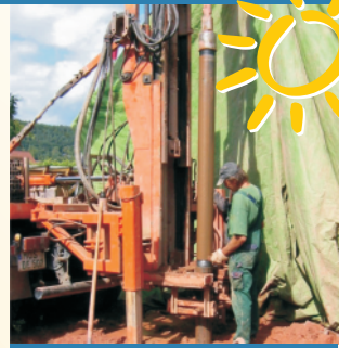
Brunnen- und Erdbohrungen mit unserem Partner Fa. Voll vor Ort.

Im Steiner 20 • 63924 Kleinheubach Tel. (0 93 71) 48 15 • www.joeger-kaufmann.de